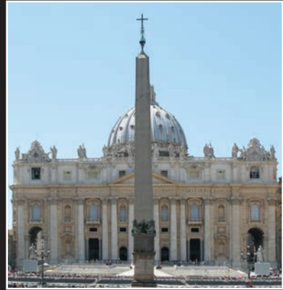
L'Église de Rome