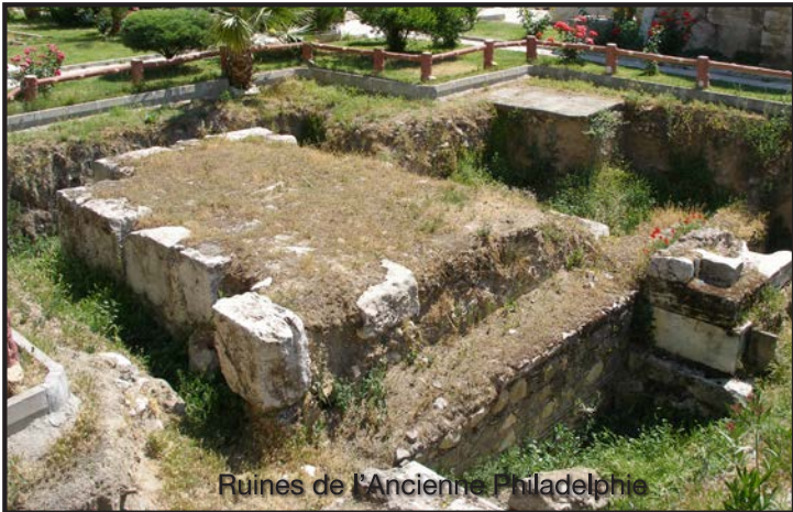
Ruines de l'Ancienne Philadelphie

Les deuxièmes et troisièmes chapitres du Livre de l'Apocalypse contiennent des messages de Jésus Christ pour sept églises. Beaucoup croient que ces églises représentent l'église à travers l'âge de l'église (du Jour de La Pentecôte dans des Actes 2 jusqu'au retour de Jésus Christ.)