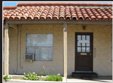
Église Continue de Dieu

Jésus a dit que Son Église continuerait (Matthieu 16:18)