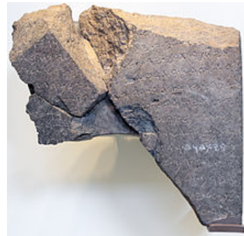
Tel Dan Stele

Es sei auch darauf hingewiesen, dass die Inschrift „Haus von David“ auch auf der Tel Dan Stele gefunden wurde (9. Jahrhundert B.C.) und auf der Mesha Stele (9 Jh. B.C.). (Wood BW. The Tel Dan Stela and the Kings of Aram and Israel. Associates for Biblical Research, May 4, 2011).