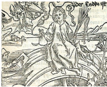
Deutsche Künstlerdarstellung vom Mann der Sünde, 1498