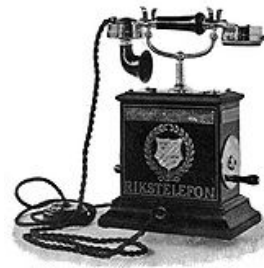
1896 Telefon aus Schweden

Von Alfred e. Carrozzo ( ursprünglich in Tomorrow's World Magazine veröffentlicht, May 1971; mit einigen Bearbeitungen der biblischen Erweiterungen von Bob Thiel )