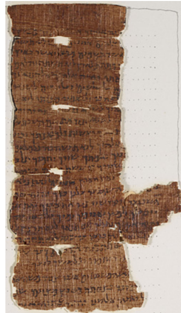
Version der Zehn Gebote in hebräisch